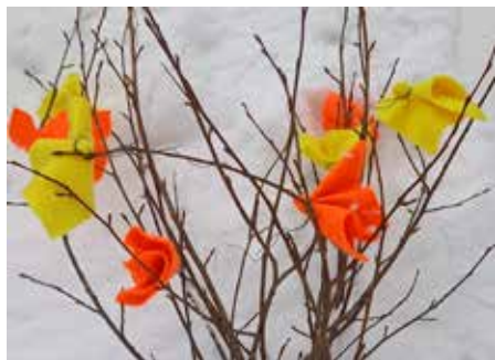
Påskdekor visar vägen

För att hitta till deltagarna följer du orange skyltar märkta "Vår konst" samt deltagar-nummer. Du är framme, när du ser Vår konst-affischen samt orange och gula påskdekorationer.