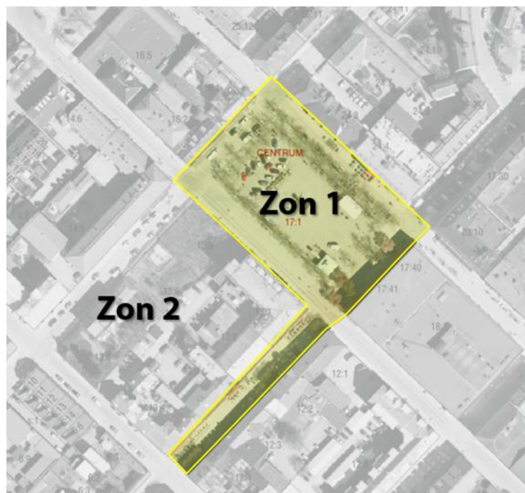
Bild 2. Zoner som gäller uteserveringar och varuexponering