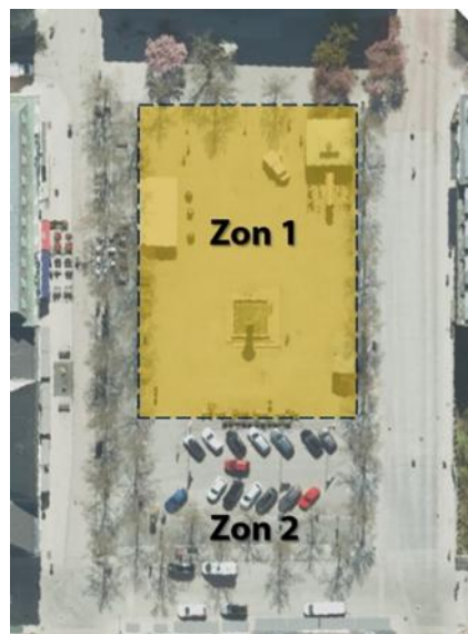
Bild 1. Zoner som gäller torghandel